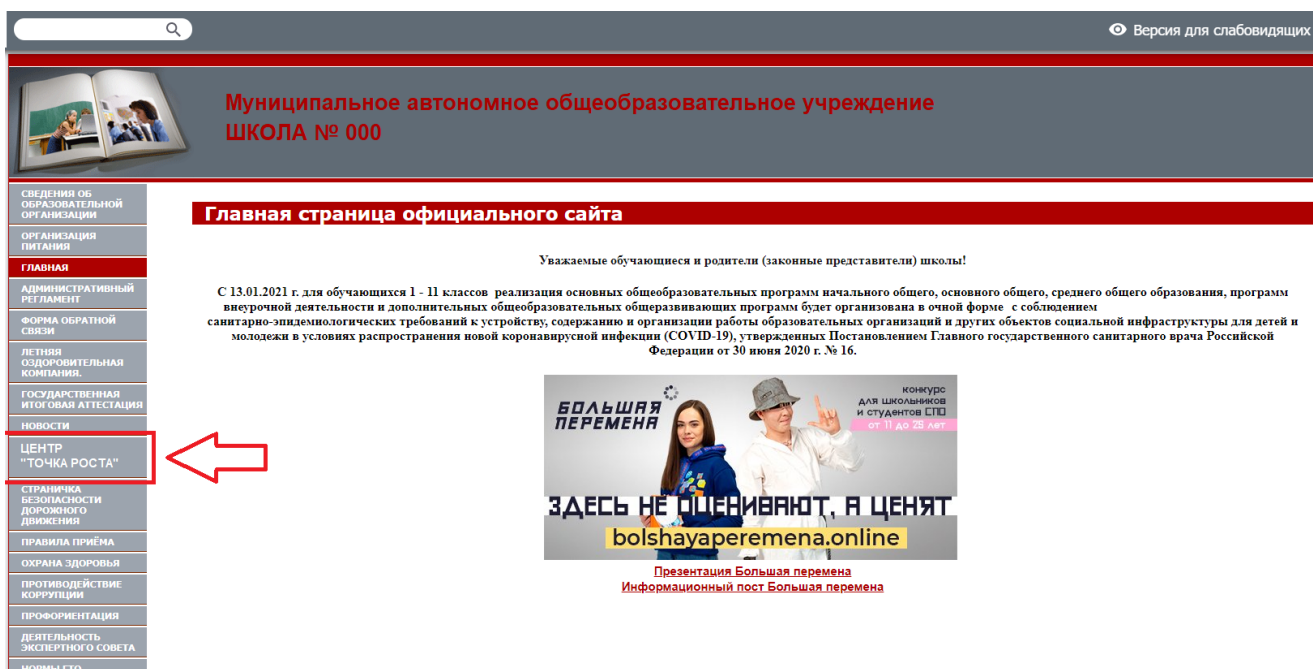
Рисунок 2. Пример размещения ссылки на раздел на сайте общеобразовательной организации

На официальном сайте общеобразовательной организации, в которой создается центр образования естественно-научной и технологической направленностей «Точка роста» (далее – центр «Точка роста», центр) в рамках федерального проекта «Современная школа» национального проекта «Образование», не позднее даты начала функционирования центра (не позднее 1 сентября года создания центра) создается раздел «Центр «Точка роста». Ссылка на раздел размещается в главном меню сайта общеобразовательной организации и должна быть видима при просмотре каждой страницы. Ссылка не может являться вложенной в другие меню. Пример размещения ссылки на раздел «Центр «Точка роста» в меню официального сайта общеобразовательной организации в информационно-телекоммуникационной сети «Интернет» приведен на рисунке 2.